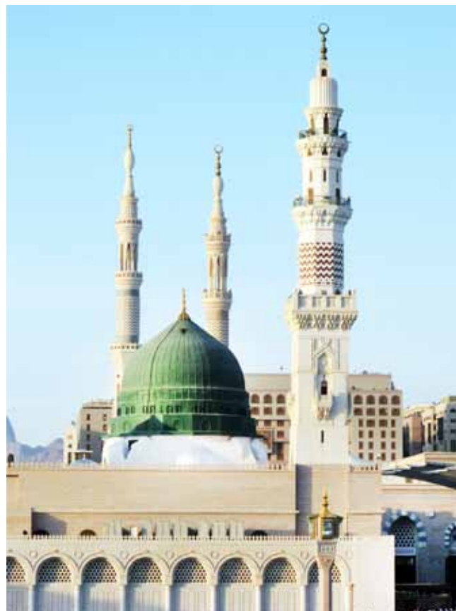
مدینه منوره - السلام علیک یا رسول الله (ص)